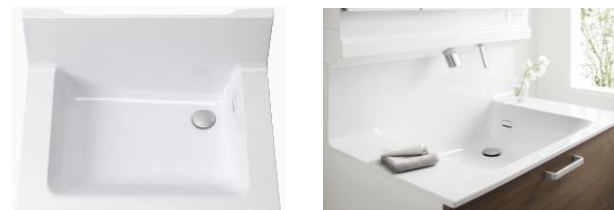
洗面ボウル一体カウンター(間口750mm/実容量12L)